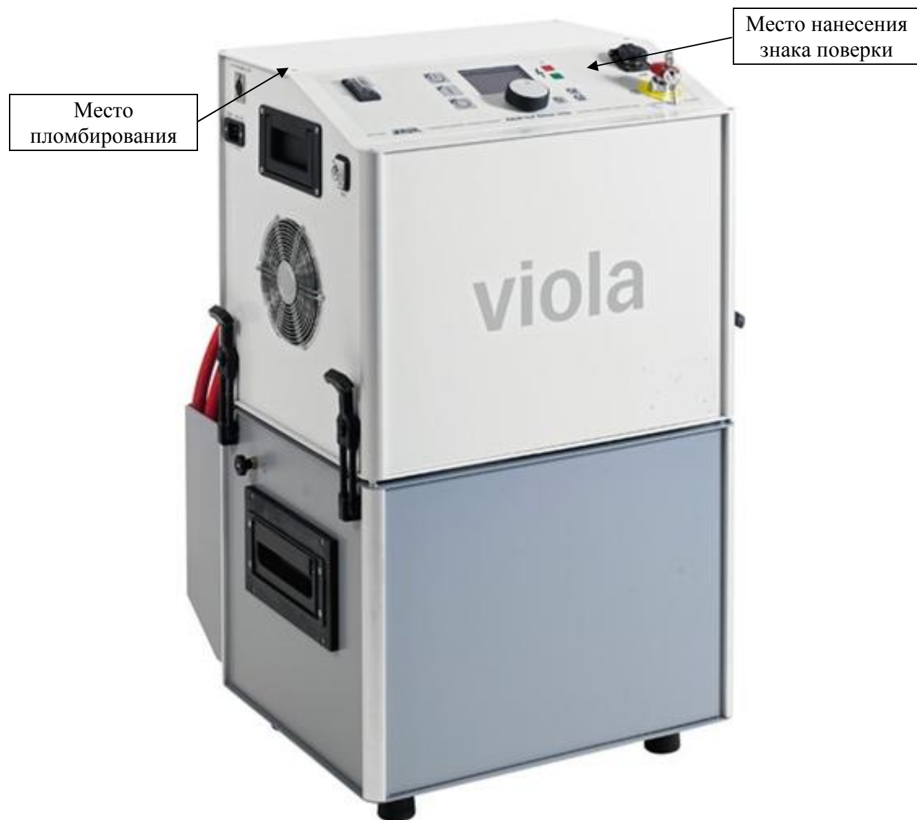
Рисунок 2 – Общий вид генераторов модификации Viola